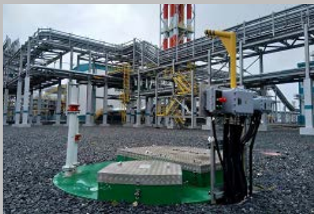
Производство и поставка 30-и комплектных КНС ПАО "СИБУР Холдинг" Западно- Сибирский Нефтехимический комбинат Г. Тобольск