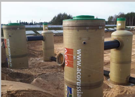
Индустриальный парк "Великий камень" "Оборудование для очистки поверхностного стока в составе ЛОС накопительного типа с самым большим в мире безбетонным аккумулирующим резервуаром АСО StormBrixx, Минск, Республика Беларусь