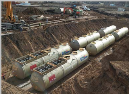
КОС ЭКО-Р-1000, ЖК "Цветы Башкирии", г. Уфа