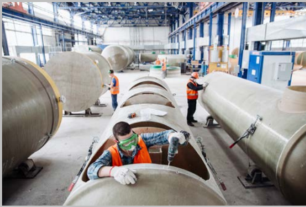
Производство г. Тольятти